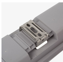
Fácil instalación de superficie y suspensión